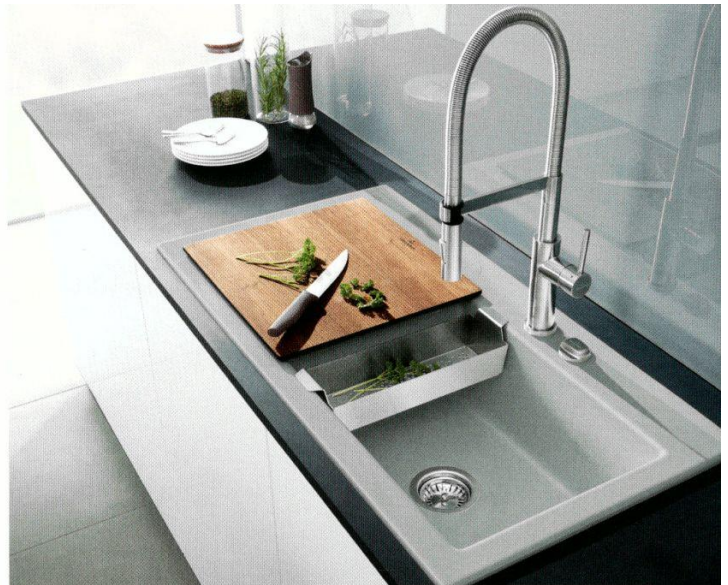
Grau ist das neue Weiß: So sagen Trendexperten bereits. Mit der hellen Nuance „Steam“ und dem dunkleren „Stone“ liegt Villeroy & Boch auf jeden Fall im Trend.