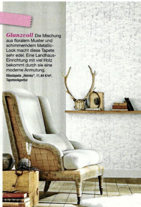
◀ Glanzvoll Die Mischung aus floralem Muster und schimmerndem Metallic-Look macht diese Tapete sehr edel. Eine Landhaus-Einrichtung mit viel Holz bekommt durch sie eine moderne Anmutung. Vliestapete „Heinko“, 11,44 €/m 2 , TapetenAgentur