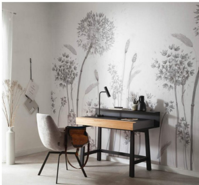
DIE DIGITALDRUCK-TAPETE BREEZE GEHÖRT ZUR AKTUELLEN SCHÖNER WOHNEN II - KOLLEKTION. FOTOCREDIT: MOTIV NATURTALENTE VON DER MARBURGER TAPETENFABRIK.