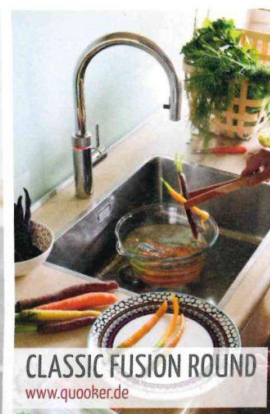
CLASSIC FUSION ROUND www.quooker.de