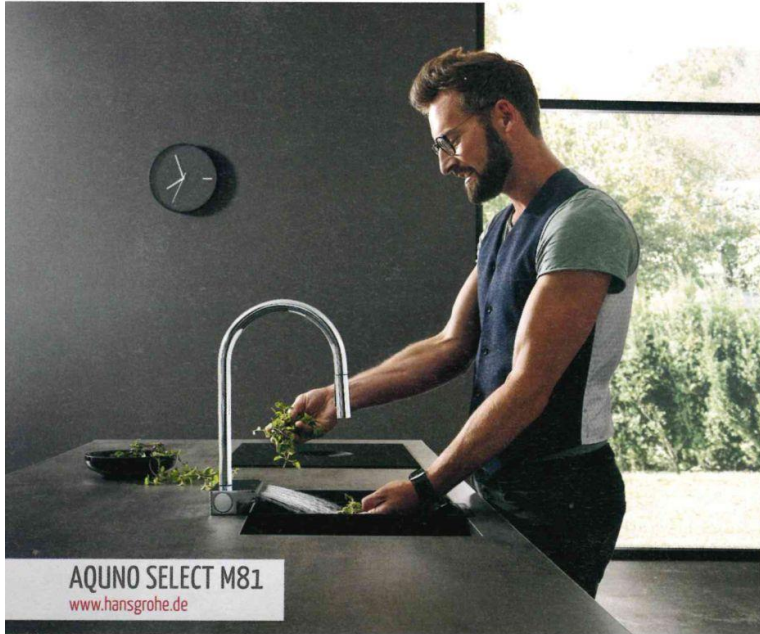
AQUINO SELECT M81 www.hansgrohe.de