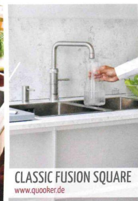
CLASSIC FUSION SQUARE www.quooker.de