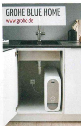
GROHE BLUE HOME www.grohe.de

Auch bei kleinen Küchen muss man nicht auf Komfort verzichten: Die Keramikspüle „Siluet 60 S“, hier im neuen Farbton Almond, gibt es ab 50 Zentimeter Breite, mit Ausgussbecken (Bild rechts, www.villeroy-boch.de ). Größere Varianten haben eine Abtropffläche.