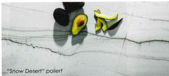
„Snow Desert“ poliert