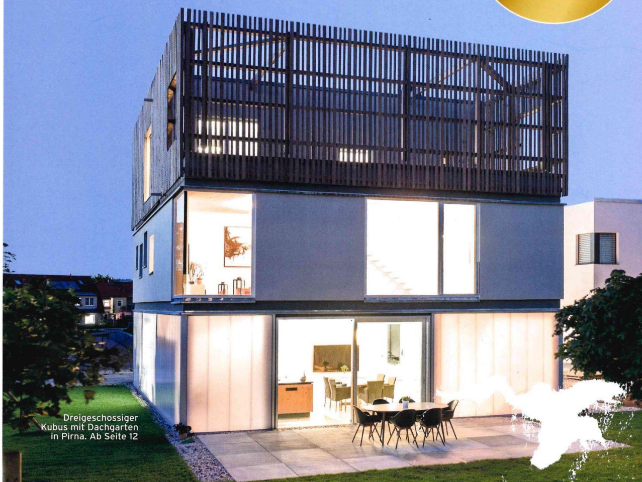
Dreigeschossiger Kubus mit Dachgarten in Pirna. Ab Seite 12