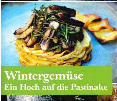
Wintergemüse Ein Hoch auf die Pastinake

WINTER-GRILLEN Rezepte, Equipment & mehr