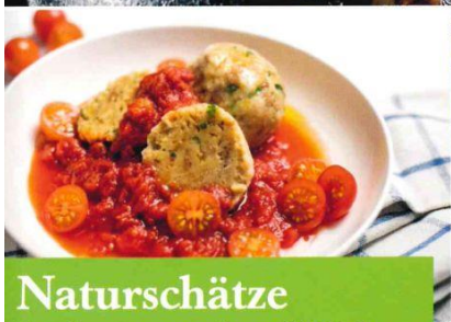
Naturschätze Leckeres aus dem Wald