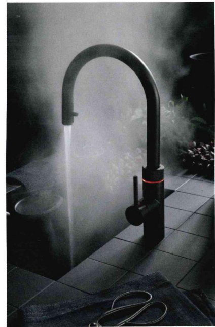
Ein echter HinQuooker: der „Quooker Flex“ in schwarzem Finish.