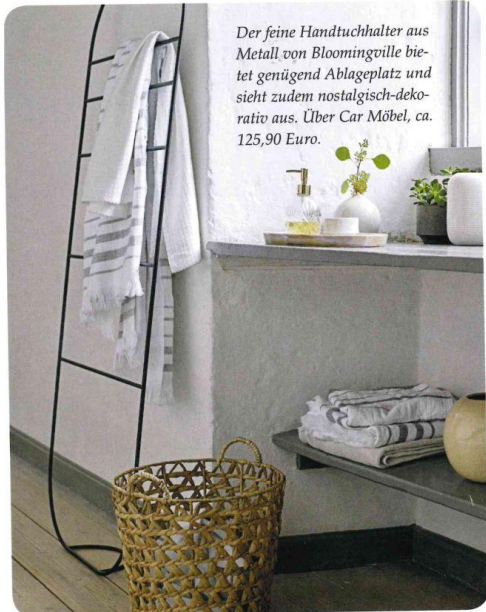
Der feine Handtuchhalter aus Metall von Bloomingville bietet genügend Ablageplatz und sieht zudem nostalgisch-dekorativ aus. Über Car Möbel, ca. 125,90 Euro.