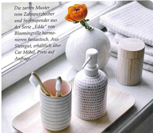
Die zarten Muster vom Zahnpuzbecher und Seifenspender aus der Serie „Edda“ von Bloomingville harmonisieren fantastisch. Aus Steingut, erhältlich über Car Möbel. Preis auf Anfrage.