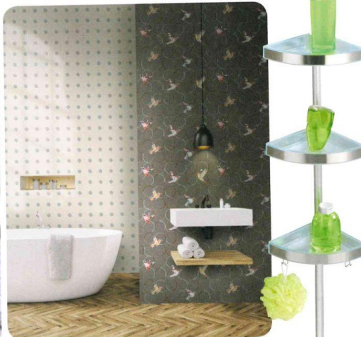
Design-Tapeten aus der Kollektion „Imagination“ von Ulf Moritz machen das Bad zum exklusiven Eyecatcher. Ein dreidimensionales Punktraster setzt die Wanne in Szene und federleichte Vögel umgeben das Waschbecken. Preis: ab 89,95 Euro/Rolle, Marburger Tapetenfabrik.