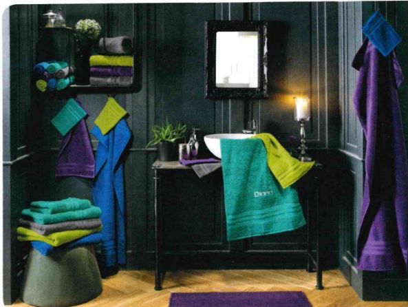
Die schönen Handtücher der Walk Frottieserie „Tübingen“ setzen farbige Highlights im Badezimmer. Über Erwin Müller.