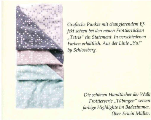
Grafische Punkte mit changierendem Effekt setzen bei den neuen Frottiertüchern „Tetris“ ein Statement. In verschiedenen Farben erhältlich. Aus der Linie „Yu!“ by Schlossberg.