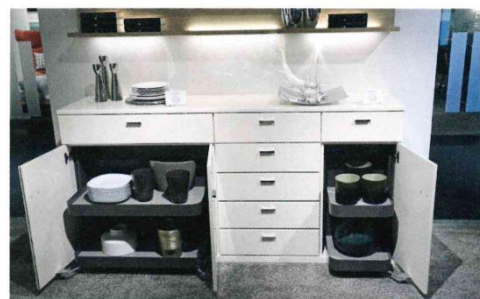
Gemeinsam mit Vauth Sagel hat RMW neue spannende Konzepte für die Schrank-Innenausstattung entwickelt.

Bei den Rietberger Möbelwerken RMW stand in diesem Jahr die Produktpflege im Mittelpunkt, nachdem ja erst im vergangenen Jahr die Produktkategorie Schlafzimmer neu besetzt wurde. Mit der neuen Trend-Lackfarbe Reseda-Grün, die sich hervorragend mit Eiche kombinieren lässt, sowie einer neuen Asteiche in Furnier und Massiv setzte man aber trotzdem stilistische Zeichen. Ein zusätzliches Highlight war die Konzentration auf neue Komfort-Innenausstattungen für die Schränke. Unternehmens-Chef Rudolf Eikenkötter sieht hier für den Wohnraum großen Nachholbedarf im Vergleich zur Küche und zeigte zur Hausmesse erste Produkte, wie Tablar-Auszüge, die bereits beim Öffnen der Tür herausfahren. Diese Ideen wurden gemeinsam mit den Innenausstattungs-Experten von Vauth Sagel, entwickelt und auch für die Zukunft verspricht Eikenkötter in dem Bereich noch viel Neues.