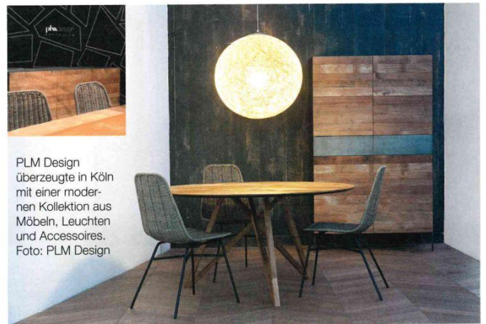
PLM Design überzeugte in Köln mit einer modernen Kollektion aus Möbeln, Leuchten und Accessoires.