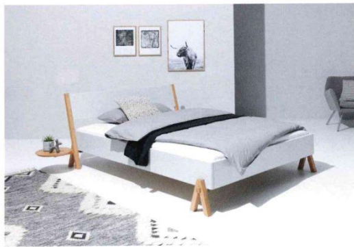
Zu den Messehighlights gehörte das „BOQ“-Bett von Michael Hilgers.

Zu den Messehighlights gehörte das „BOQ“-Bett von Designer Michael Hilgers. Das filigrane Design lässt das Bett auch in kleinen Räumen luftig erscheinen. Um einen schnellen und unkomplizierten Aufbau zu ermöglichen, sind Rahmen und Kopfteil als solide Handwerksböcke gefertigt. Die klassischen Holzverbindungen ermöglichen dabei eine maximale Stabilität.