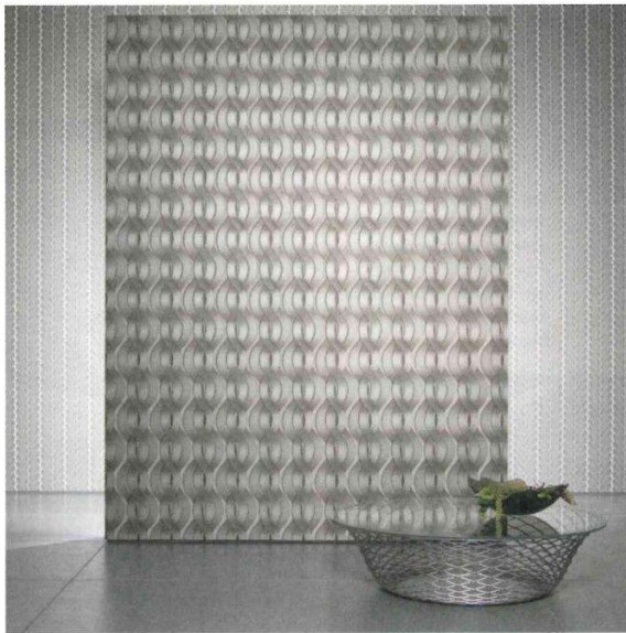
Fühlbarer Schwung: Ein Paneel mit applizierten Perlenbögen setzt Colanis Handschrift dreidimensional in Szene.