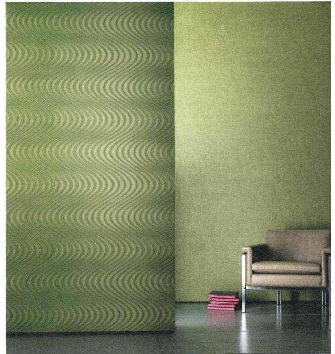
Die Wellenstruktur in Eidechsengrün erscheint aus der Distanz betrachtet wie ein horizontaler Streifen. Kollektion „Legend“ umfasst 47 Tapetendesigns auf Vliesträger.