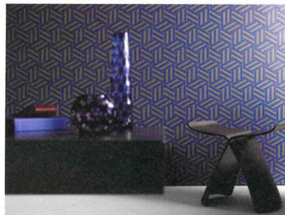
Geometrische Formen in architektonischer Anmutung werden mit Granulat oder erhabenen Konturen veredelt