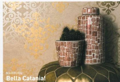
MARBURG Bella Catania!

Ihre Namenspatin liegt an der sizilianischen Küste und so verwundert es nicht, dass bei Marburgs Kollektion 'Catania' Wasser eine zentrale Rolle spielt. Die 59 Vliestapeten sind durchweg mit Farben auf Wasserbasis hergestellt, was ihnen eine angenehme Griffigkeit und fein dosierte Kolorierung verleiht und sie gleichzeitig ohne Weichmacher und PVC auskommen lässt. Hommage an die Natur mit italienischem Chic: Bella Catania!