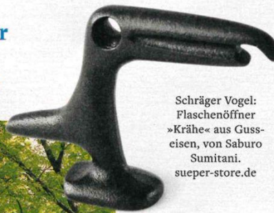
Schräger Vogel: Flaschenöffner »Krähe« aus Guss-eisen, von Saburo Sumitani. sueper-store.de