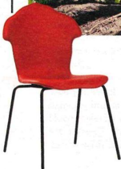
Täglich Rot: Stuhl »Shadov Chair« aus der Home-Kollektion von Versace mit lederbezogener und gepolsterter Sitzfläche. versace.com/de