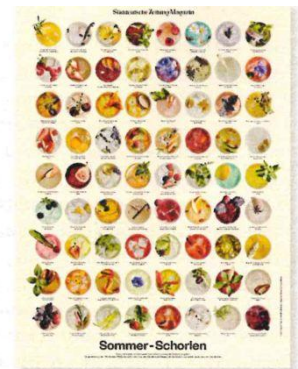
Tatendurst? Dann probieren Sie doch mal eines der 72 Schorle-Rezepte, die wir auf diesem schönen SZ-Magazin-Poster versammelt haben. sz-shop.de/schorlen