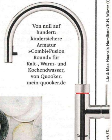
Von null auf hundert: kindersichere Armatur »Combi+Fusion Round« für Kalt-, Warm- und Kochendwasser, von Quooker. mein-quooker.de