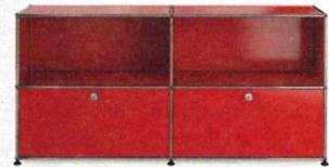
Alles im Kasten: Sideboard »Anrichte« in Rubinrot aus Metall mit Klapptüren. usm.com