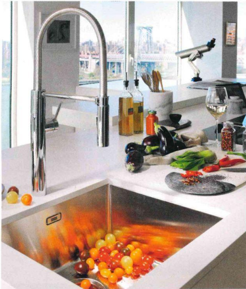
Die semi-professionelle Armatur „Pescara“ ist perfekt geeignet für große Spülbecken wie die Edelstahlspülen-Serie „Box“. (Von Franke)

Auch die Auslaufhöhe und der Schwenkradius sind wichtige Auswahlkriterien. Spezialarmaturen können zusätzlich rund um die Uhr kochendes Wasser liefern. Und für Technikfreaks bieten sich digital gesteuerte Armaturen an: Wassermenge und -temperatur werden vorgewählt, und das Wasser strömt nach Berühren eines Sensors oder Fußschalters. ●●●